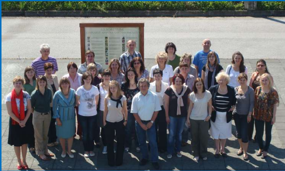
NASTAVNIČKO VIJEĆE GIMNAZIJE ANTUNA GUSTAVA MATOŠA ŠK. G. 2010./2011.